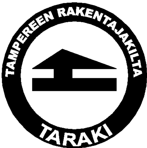
Kuva 2: Killan merkki