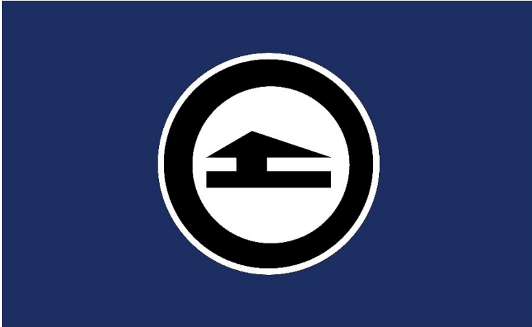
Kuva 3: Killan lippu